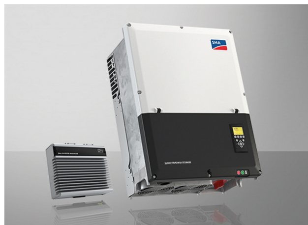
SMA Tripower Storage 60 mit SMA Inverter Manager Storage